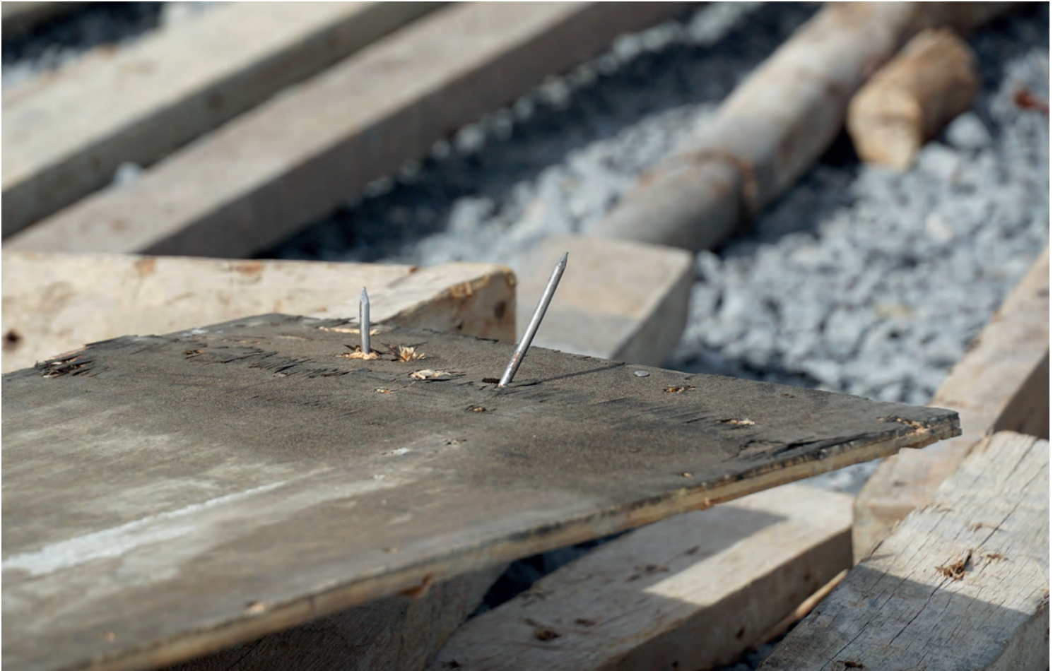
Een ongeluk ligt altijd op de loer.

klaar. Als ik 's ochtends binnenkom, hoef ik alleen het knopje om te zetten. Dan maak ik de container open. Als iedereen is binnengestroomd, is er koffie en spreken we alles door. Zodat iedereen weet wat hij moet doen die dag. Dat is het ochtendritueel.”