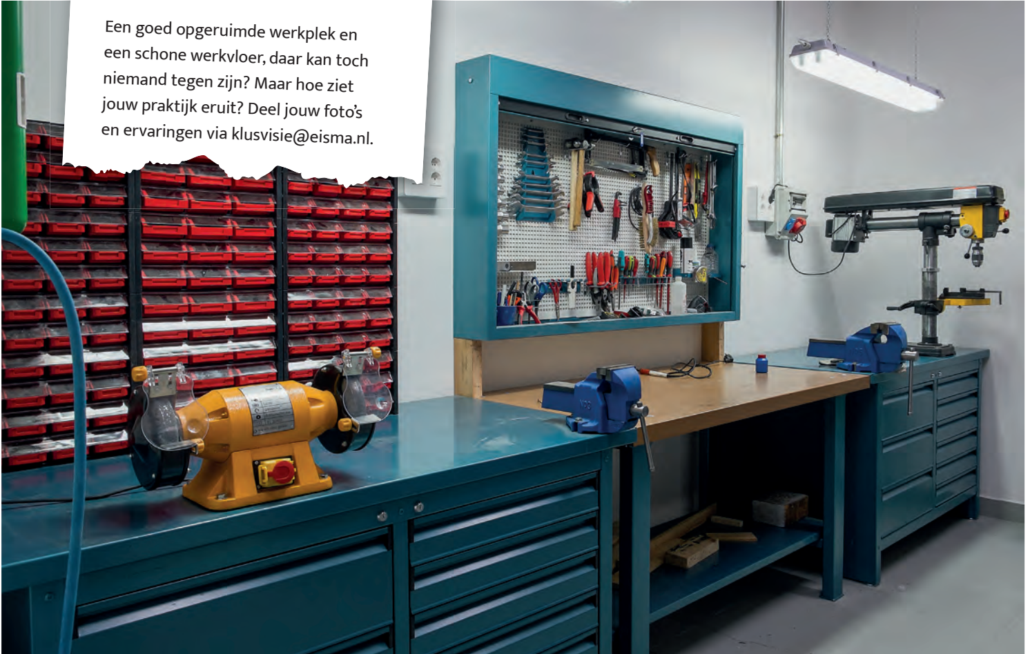
Een strak geordende werkplek; daar wordt toch iedereen blij van?

Voor zijn manier van werken is een werkplaats noodzaak, zie bijvoorbeeld de al genoemde afzuiginstallatie. “Dan word je te duur, hoor ik wel eens als argument om dat niet te doen. Ik denk dat dat onzin is: als de klant keurig netjes werk krijgt en het allemaal netjes is geregeld, betaalt hij heus wel. Dat is het probleem niet. Het is de ‘mindset’ die doorbroken moet worden van degene die aan het werk is, waardoor de klant heel anders tegen jou aan gaat kijken.” Moet hij zijn manier van werken wel eens uitleggen aan een klant? Die bijvoorbeeld niet begrijpt dat er kosten worden gerekend voor maatregelen die de boel schoon en opgeruimd houden? “Er komt wel eens tegengas”, beaamt Helling. “Maar op het moment dat we aan het werk zijn en klanten zien wat je aan het doen bent en op welke manier, dan laten ze dat los en is er 100% vertrouwen in de manier waarop er wordt gewerkt.”