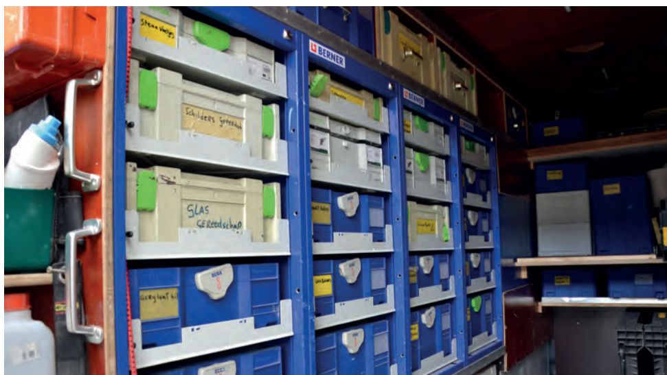
Een overzichtelijke indeling bespaart veel zoekwerk en dus tijd.

Aan de andere kant van de woonkamer is een geluidwerende wand gemaakt. Zodat de eigenaar van het pand, die achter die